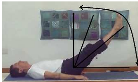
Sollevo gambe + divaricare