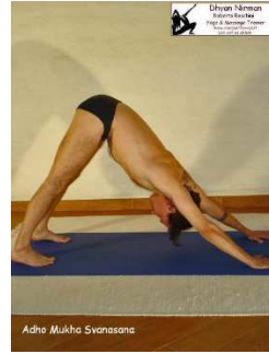
Adho muka svanasana